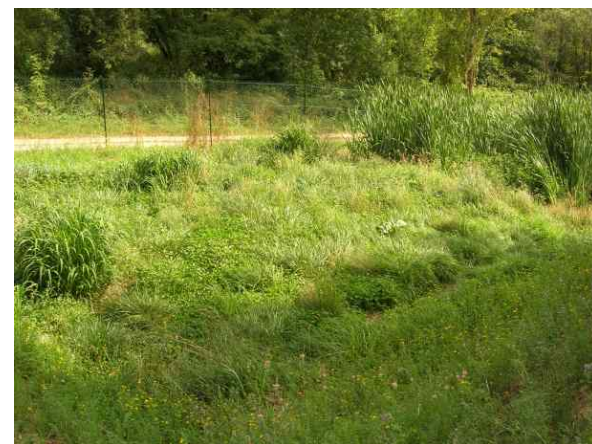
Bassin colonisé par la glycérie et l'iris des marais