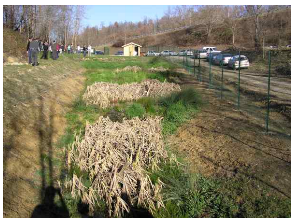
Vue des bassins, 6 mois après leur réalisation

Un inventaire complet (faune-flore) a été commandé au Conservatoire Régional des Espaces Naturel de Midi-Pyrénées (CREN M-P) et à la Ligue de Protection des Oiseau du Tarn (LPO 81) par le Conseil Général du Tarn.