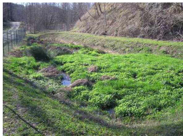
Vue du deuxième bassin (novembre 2007)