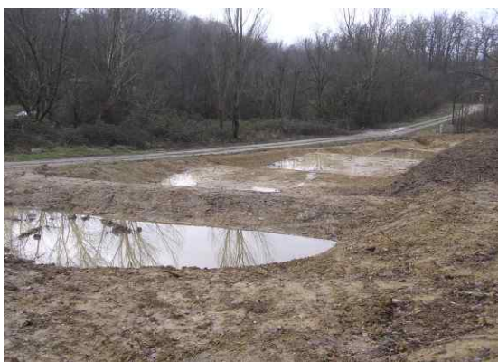
Vue des bassins, durant les travaux (février 2007)

Lors de la réalisation de la station de traitement des eaux usées de Montans (filtre planté de roseaux), la création d'une zone de dissipation a été proposée à la municipalité sur une zone inutilisée de l'emprise dédiée à la STEP. Cet aménagement permet d'améliorer la qualité du rejet (notamment nitrates et bactéri.), De traiter sommairement les eaux de by-pass tout en améliorant l'intégration paysagère d'un équipement souvent peu apprécié du voisinage.