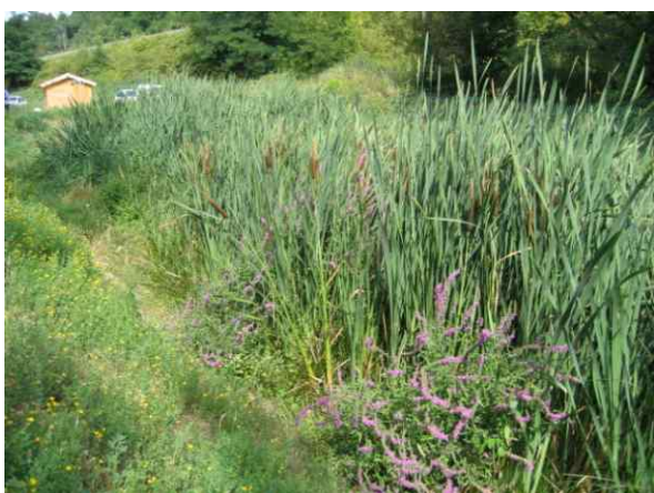
Vue du massif de typha latifolia (Septembre 2008)