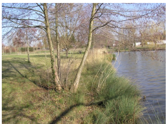
Vue du site en décembre 2007

Roselière relictuelle confinée au trait de berge (ceinture d'hélophytes) ne jouant plus de rôle fonctionnel du fait de sa faible étendue (espace tampon, limitation du batillage sur les berges lieu de nidification pour l'avifaune, site de reproduction pour le poisson...)