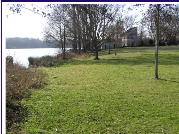
Arrière berge tondue (décembre 2006)