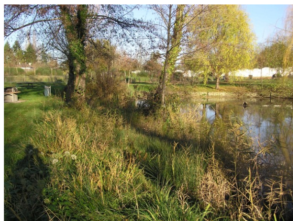
Roselière en cours de régénération (avril 2008)