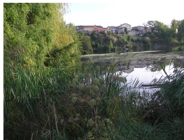
Mégaphorbiaie et roselière (Octobre 2007)