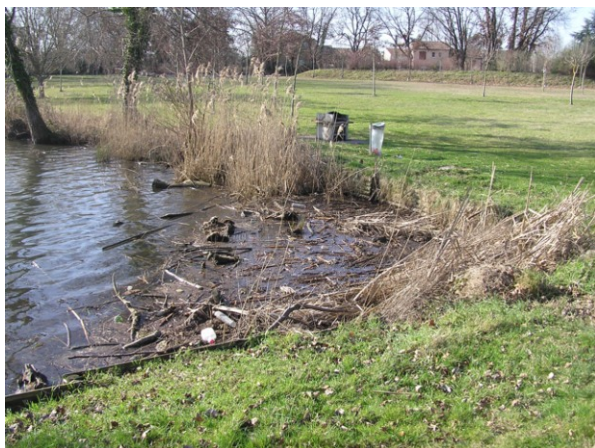
Relique de la roselière (décembre 2006)

Suivi de l'évolution site par des inventaires complémentaires. Réalisation d'un panneau d'information dans le cadre d'un projet global de sentier de découverte du site.