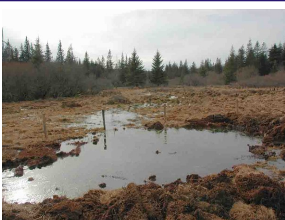
Mare et secteur de tourbière remis en eau (mars 2008)