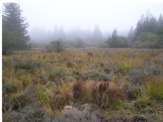
Site avant travaux, octobre 2007

Le site, en perdant son caractère humide a été peu à peu envahi par la calune, la bruyère et le saule