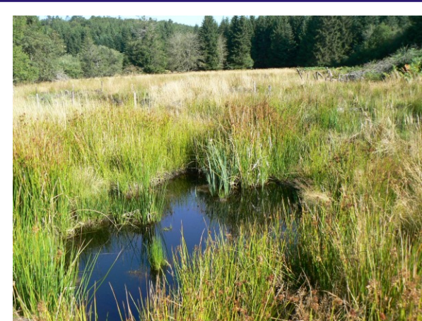
Mare colonisée par le jonc et la sphaigne (Septembre 2008)