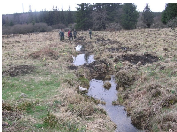
Bouchons tourbeux obturant les fossés (mars 2008)

Suivi de l'évolution site par des inventaires complémentaires. Poursuite des travaux d'obturation des fossés de drainage. Restauration hydromorphologique du suisseau traversant la tourbière Aménagement d'un sentier de découverte en périphérie du site.