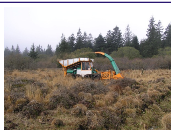
Broyage de la molinie (SCOP SAGNE - Décembre 2007)