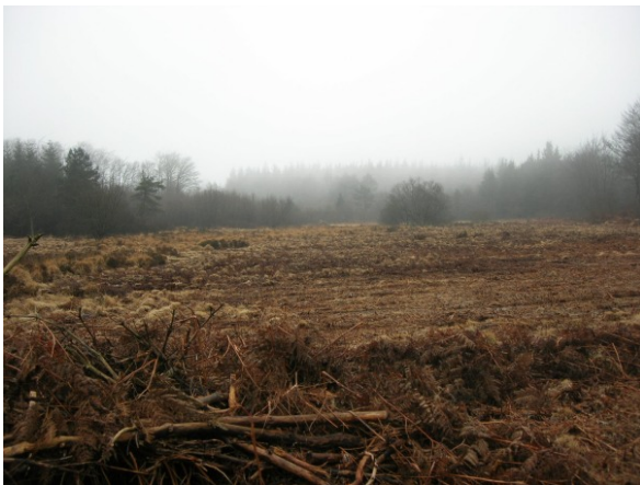
Vue générale du site durant le broyage (Décembre 2007)

Suivi de l'évolution site par des inventaires complémentaires. Organisation du pâturage du site par des chevaux (installation d'un abri et pose de clôtures).