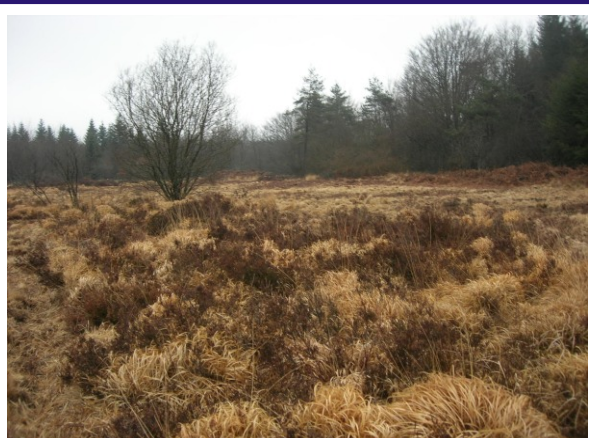
Site avant travaux, octobre 2007

Ainsi, les zones tourbeuses sont peu à peu envahies par des touradons de molinie et des fourrés de saules, les asséchant et banalisant peu à peu.