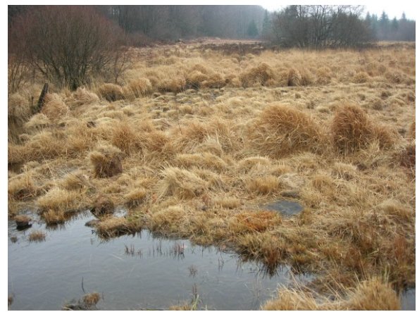
Mare créée par l'obturation d'un fossé ( Décembre 2007)