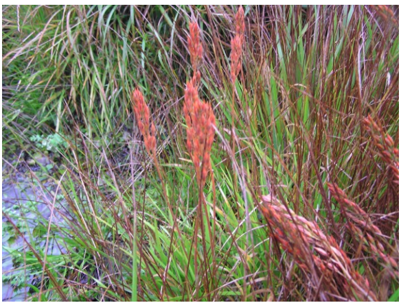
Narthecium ossifragum présente sur le site (Novembre 2007)