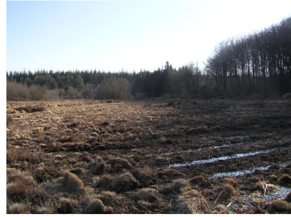
Vue hivernale du site restauré (Janvier 2008)