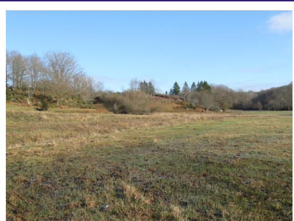
Secteur de sagne enfin accessible aux engins (Novembre 2008)