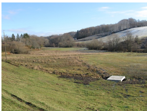
Vue du pont et de la sagne (Novembre 2008)