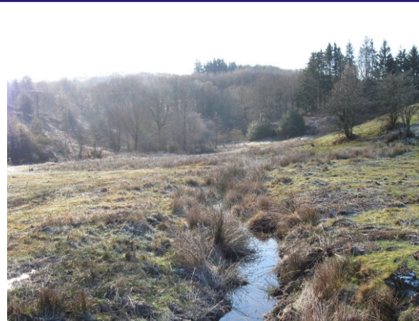
Ruisseau s'écoulant à travers la sagne (Novembre 2008)