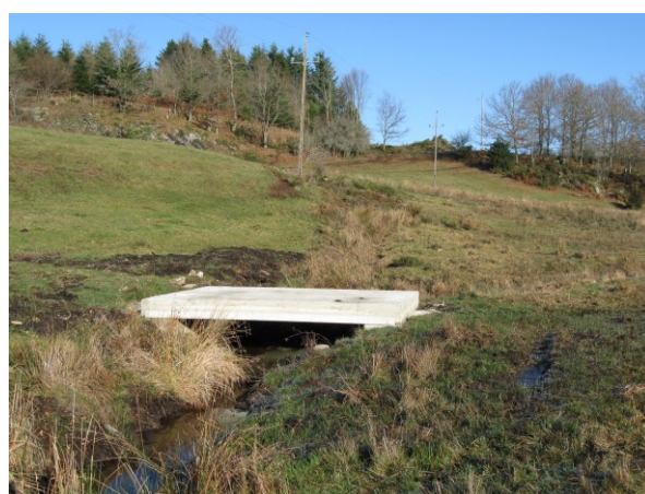
Pont cadre achevé (Novembre 2008)