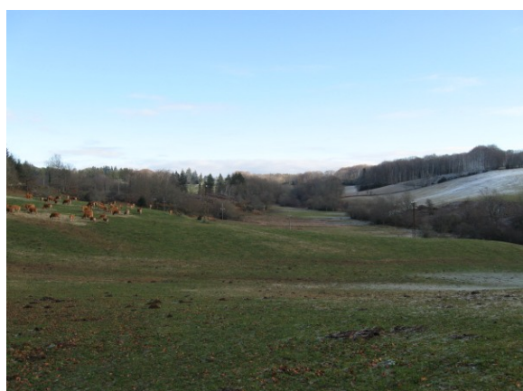
Vue générale du site (Novembre 2008)

La tourbière de la Souque est située en contrebas du hameau de la Souque, dans les Monts d'Anglès. Ce site régulièrement pâturé par un troupeau bovin (Vaches limousines et leurs veaux) ne présente pas de signe d'enfrichement marqué. Cependant la présence d'un ruisseau au milieu de la parcelle gêne l'exploitant dans la gestion de ce site, notamment lors du girobroyage annuel des refus de pâturage (joncs essentiellement) en rive gauche.