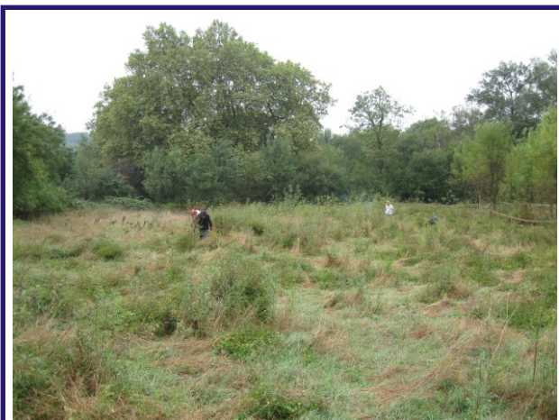
Débroussaillage sélectif (Septembre 2009)