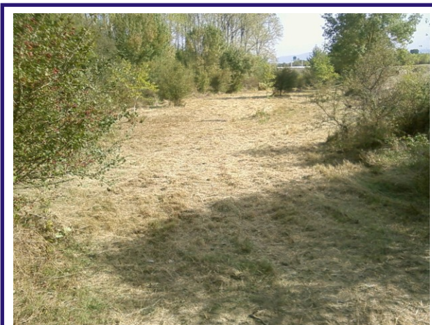
Prairie humide restaurée (Octobre 2009)