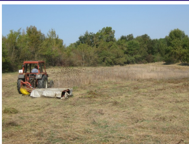
Fauche des prairies (Septembre 2009)