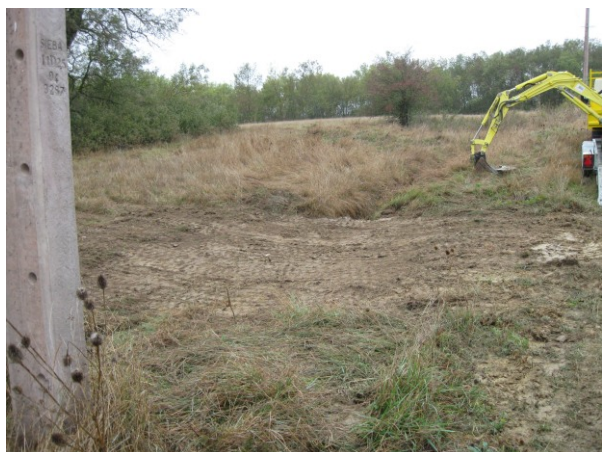
Création des points d'accès aux parcelles (Septembre 2009)

Le choix s'oriente vers une fauche tardive afin de permettre une expression maximale de la biodiversité.