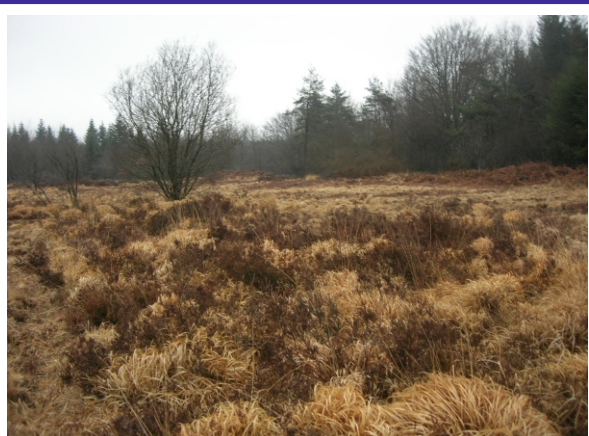
Site avant travaux, octobre 2007

Ainsi, les zones tourbeuses sont peu à peu envahies par des touradons de molinie et des fourrés de saules, les asséchant et banalisant peu à peu.