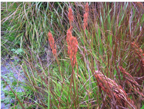
Narthecium ossifragum présente sur le site (Novembre 2007)